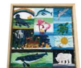
【10このちいさなおもちゃのあひる】50cm×50cm(額装)